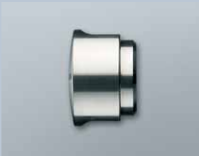
Verkürzter Knauf (Z4.KNAUF4)