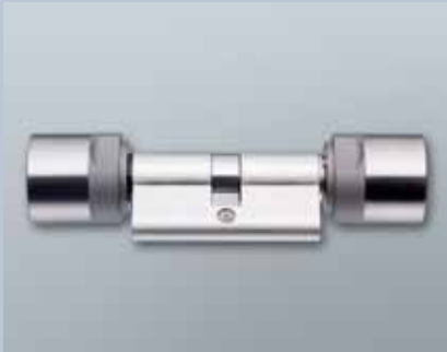
Europrofil Comfortzylinder 3061