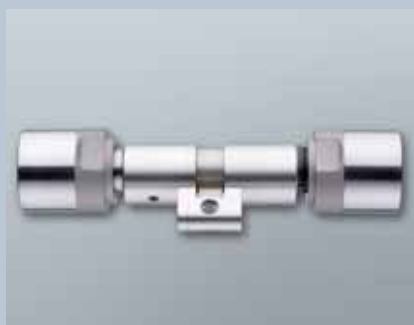
Swiss Round Comfortzylinder 3061