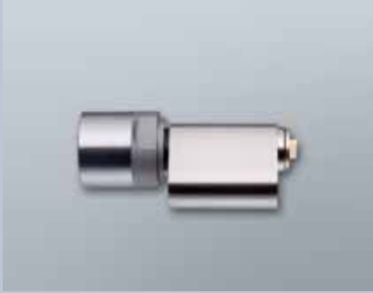
Scandinavian Oval Zylinder - G2