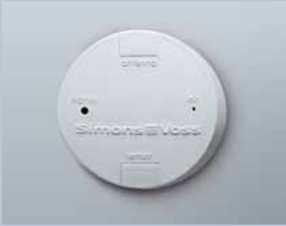
WaveNet LockNode WN.LN.R