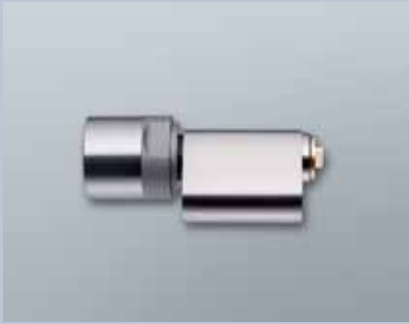
Scandinavian Oval Zylinder 3061