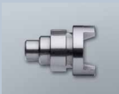
Kernziehschutzadapter für TN4-Zylinder