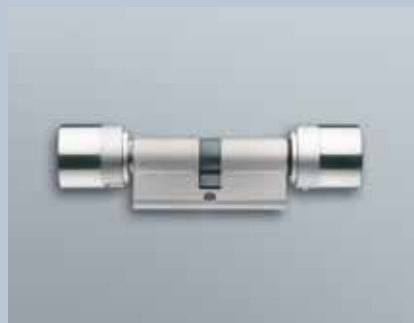
Europrofil Schließzylinder mit Tastersteuerung