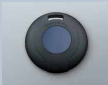
Transponder 3064 mit blauem Taster