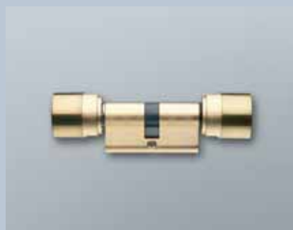
Europrofil Schließzylinder in Messingausführung