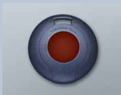
Transponder 3064 mit rotem Taster