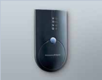
Programmiergerät SmartCD - G2