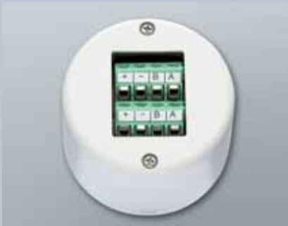
WaveNet LockNode WN.LN.C