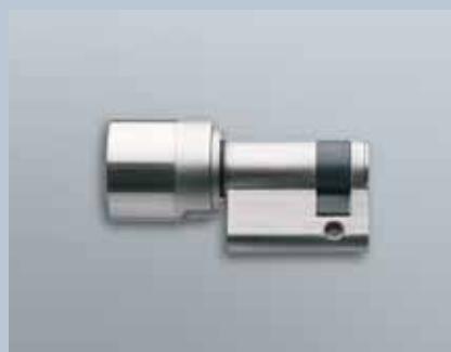
Europrofil Halbzylinder 3061