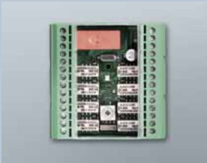
Smart Output Modul