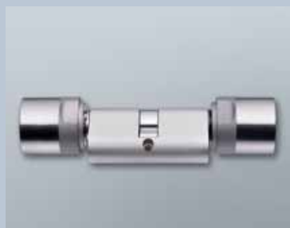
British Oval Doppelknaufzylinder 3061