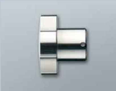
Knauf für schwergängige Türen (Z4.KNAUF2)