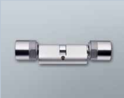
British Oval Comfortcylinder 3061