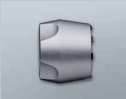
Knauf für schwergängige Türen (Z4.KNAUF3)