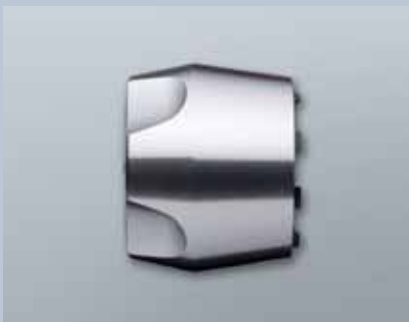
Knauf für schwergängige Türen (Z4.KNAUF7)