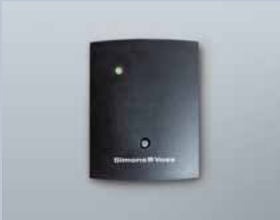
Digitales Smart Relais 3063