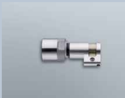
Swiss Round Halbzylinder 3061