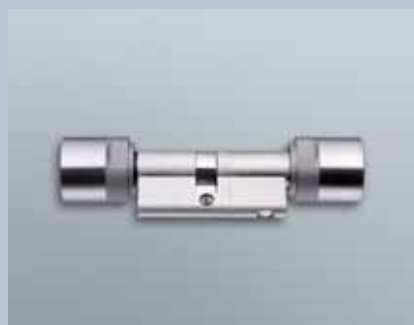
Europrofil Antipanikzylinder 3061