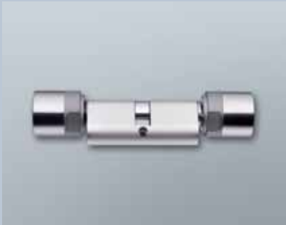
British Oval Comfortcylinder 3061 - G2