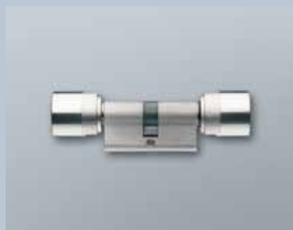
Europrofil Schließzylinder 3061